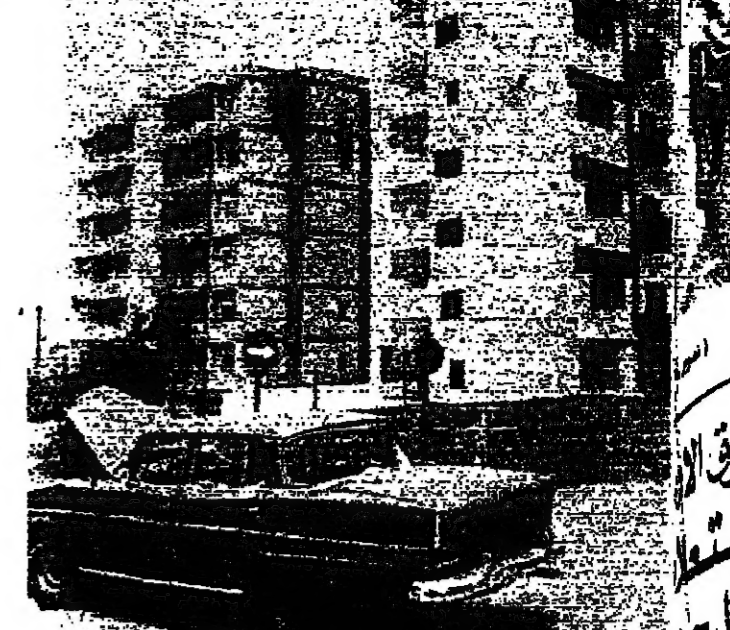
سيارة أصيبت أثناء الاشتباك بالذخيرة